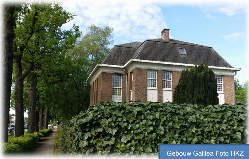
Gebouw Galilea