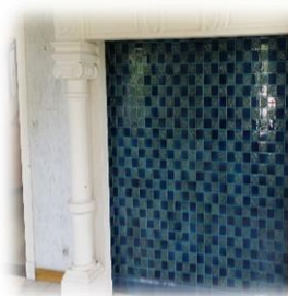
Binnenzichten Gebouw Galilea