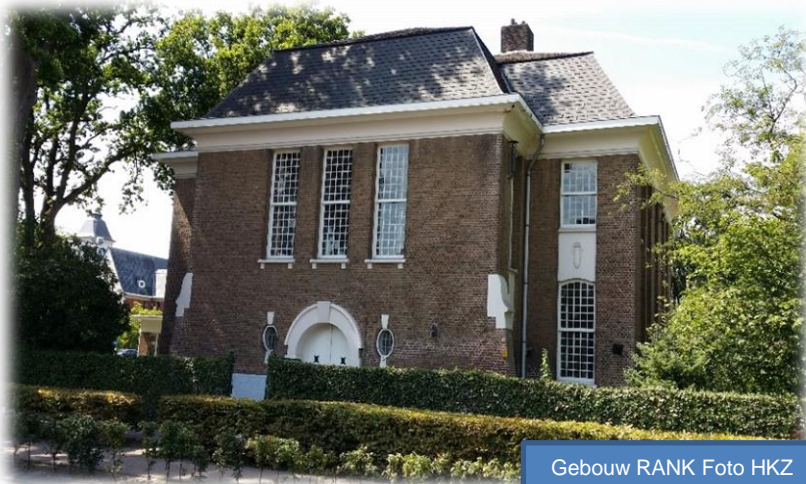
Gebouw RANK

en de gebouwen Galilea en Rank, links en rechts langs de Handelslei (de huisnummers 165 en 169, zie ook bijgaande foto's). De gebouwen achter het gemeentehuis zijn eigendom van de vzw Emmaüs, het zorgcentrum dat zorgvoorzieningen in de gezondheids- en welzijnszorg groepeert, voornamelijk in de provincie Antwerpen. Het Algemeen Ziekenhuis Sint-Jozef te Malle op de grens met Zoersel is de verdere ontwikkeling uit de psychiatrische inrichting van 1924.